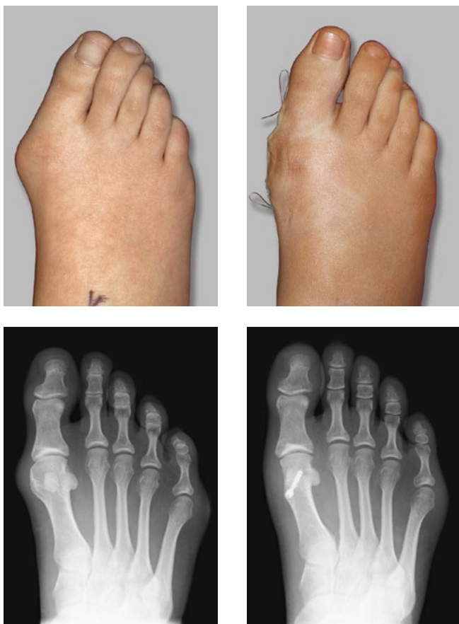
Hallux valgus vor der OP (links) und nach der OP (rechts)